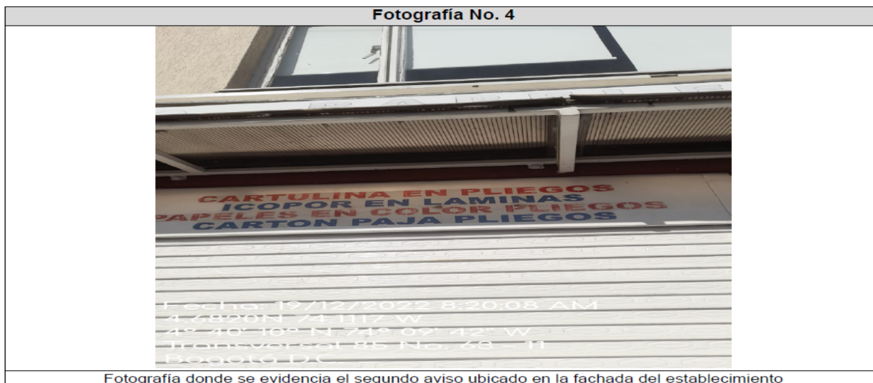
Fotografía donde se evidencia el segundo aviso ubicado en la fachada del establecimiento